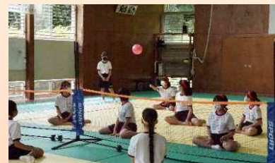
【シッティングバレーボールの体験】