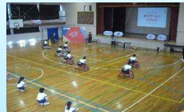
日本財団パラスポーツサポートセンターによるパラスポーツの体験 (あすチャレ!)等