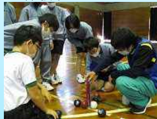
特別支援学校との パラスポーツ交流