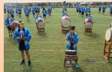
【地域の伝統文化（民謡）の発表】